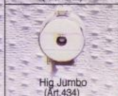
Hig Jumbo (Art.434)